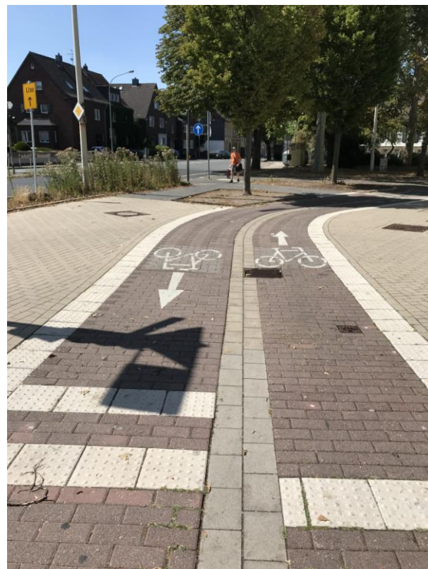
Beispiel in Hilden: Komfortabler Radwegübergang Schulstraße/Einmündung Südstraße (am Hagelkreuz)