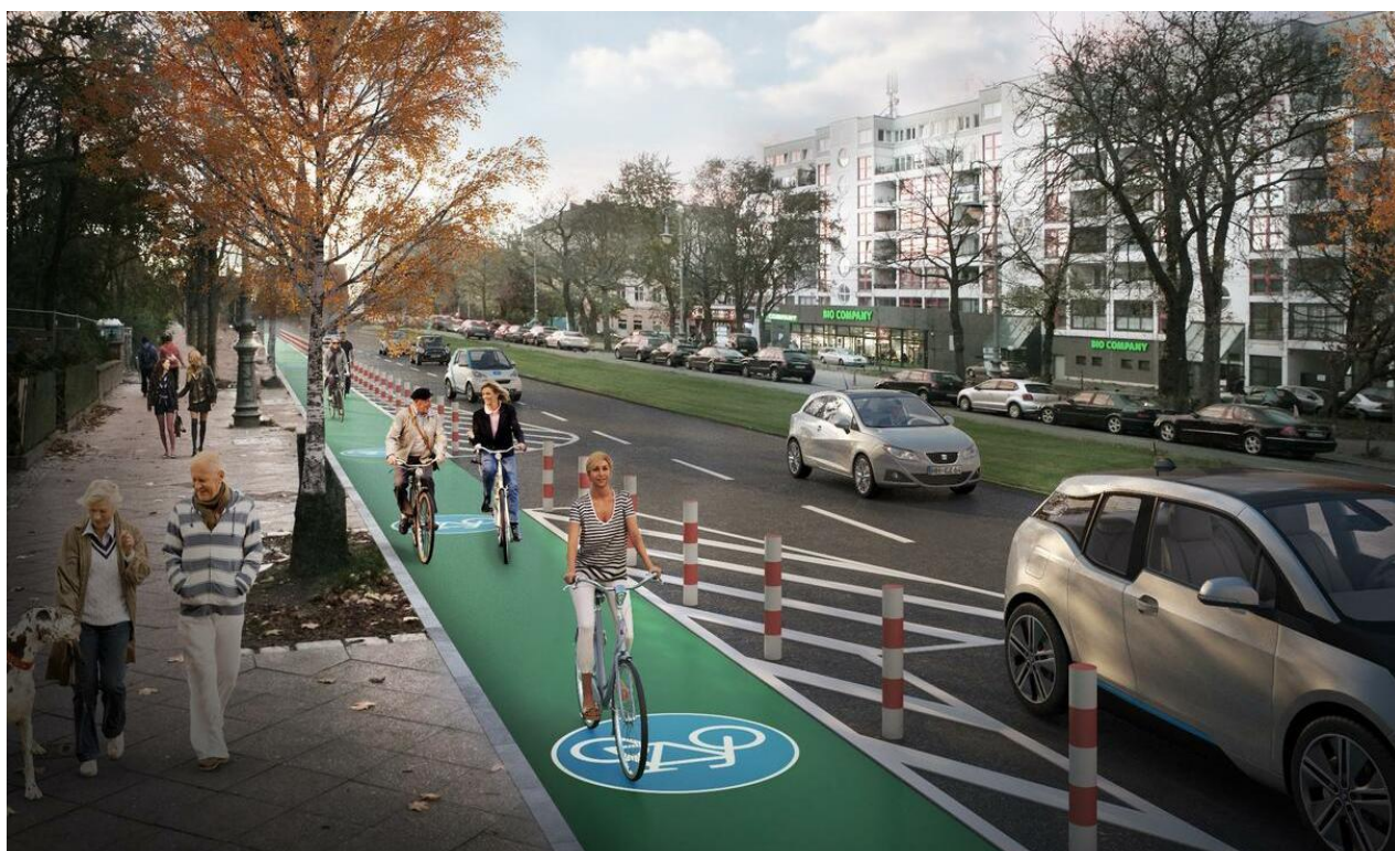
Konzept Radwegnetz Berlin